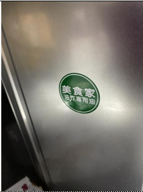
自助餐使用油：耐炸油