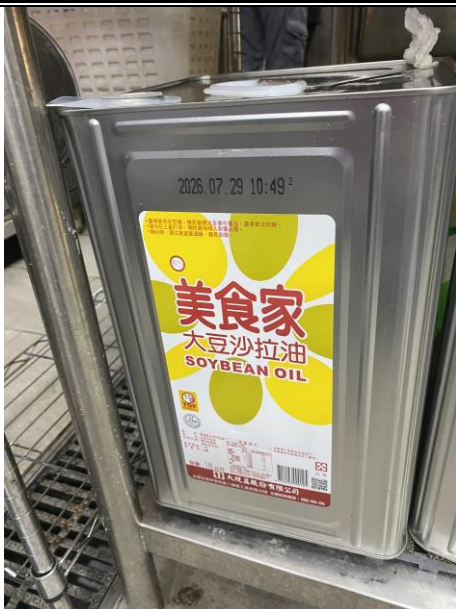
早、午餐使用油：大豆沙拉油