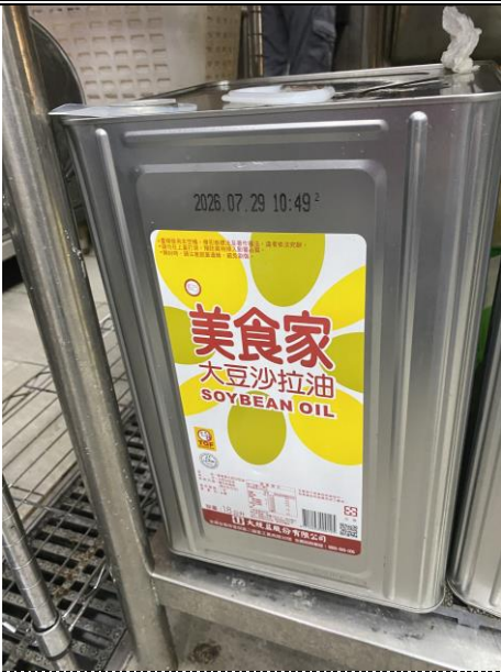
早、午餐使用油：大豆沙拉油