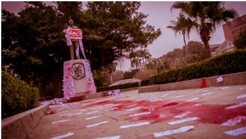
228事件六十五週年 成大蔣介石銅像遭潑漆。

「禁禁禁」時代人民權利被各種侵犯。在政府的管制之下人民沒有隱私或自由，寄信需要被拆封檢查、髮型被限制、思想被控制、接受灌輸式教育……試圖將人民變為沒有自我思想的人偶。